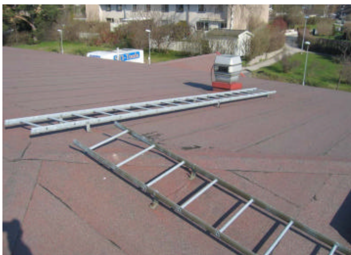
Fast taksteg till nock