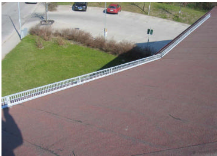
Snörasskydd enl ordningslagen 1993:1617

Projekt: Besiktning – Taksäkerhet Kund: Atrium Fastigheter – Stockholm Takentreprenör: Takmakarna - Stockholm